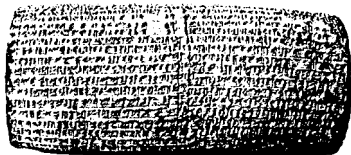
Рис 3. Летопись Набонида, в которой упоминается Валтасар и вверенное ему «царствование»

гар языческого пира, когда рекой текло вино, появились пальцы человеческой руки,