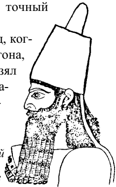
Рис. 2. Известковый барельеф Саргона II во дворце в Хорсабаде

Саргон, царь Ассирии. Исаия говорит: «В год, когда Тартан пришел к Азоту, быв послан от Саргона, царя Ассирийского, и воевал против Азота, и взял его ...» (Ис. 20:1). В этих словах пророк утверждает следующее: (1) Саргон был ассирийским царем; (2) этот царь завоевал Азот; и (3) это завоевание было осуществлено «Гартаном», то есть, его военачальником (см. примечание в СПБТ). Вплоть