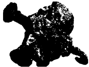
Рис. 4. Щиколоточная кость жертвы распятия, пронзенная 10-сантиметровым гвоздем (ок. 6-66 г. от Р.Х.)

Распятие. «И когда пришли на место, называемое Лобное, там распяли Его ...» (Лук. 23:33). Хотя в светской литературе первых столетий христианской эры существует множество упоминаний о распятии, первые материальные свидетельства были обнаружены в июне 1968 г. На Оружейном холме в северо-восточной части